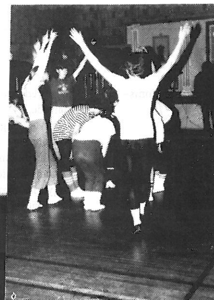
krop og sjæl