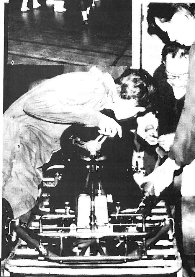
sikkerhed og fart