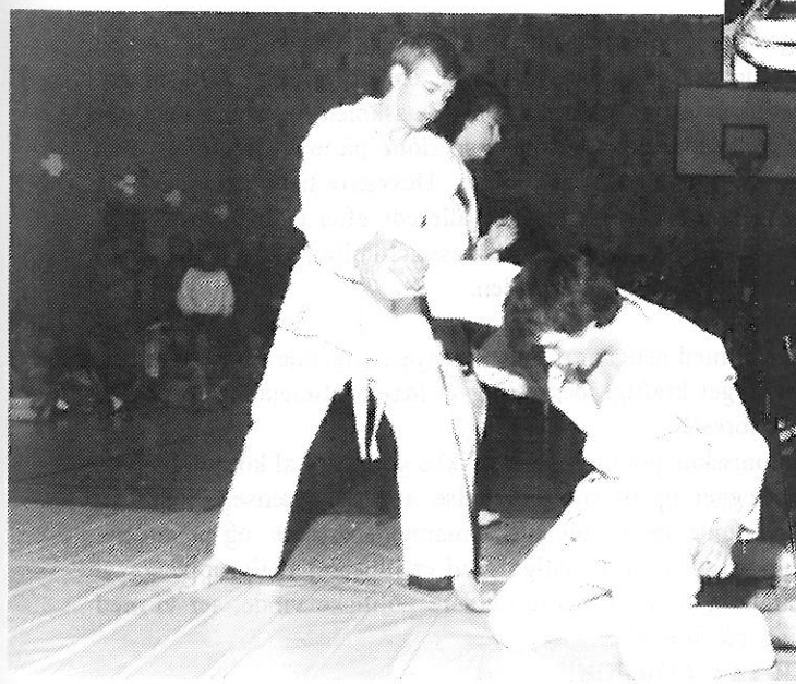
styrke og smidighed