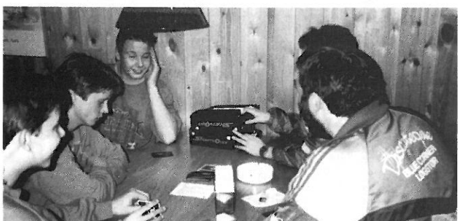
ALTID NOGEN DER GIDER...