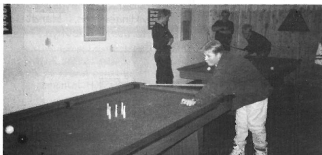
Ung og aktiv = GOD KLUB

Heltidsundervisning Produktionsskole Ungdoms- arbejdsløsheds- projekter.