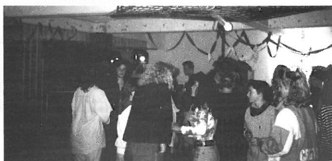
VI MØDES I »KLUBBEN«...