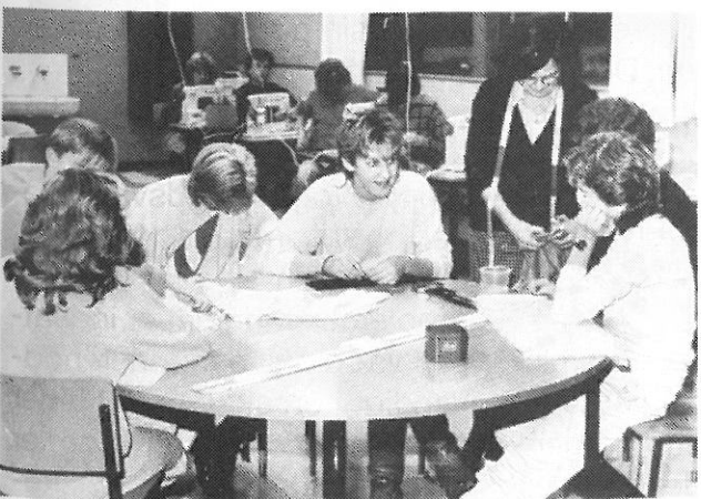
Sy dit eget tøj