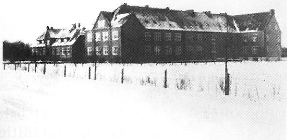
Vestergades skole (Vestervangskolen)