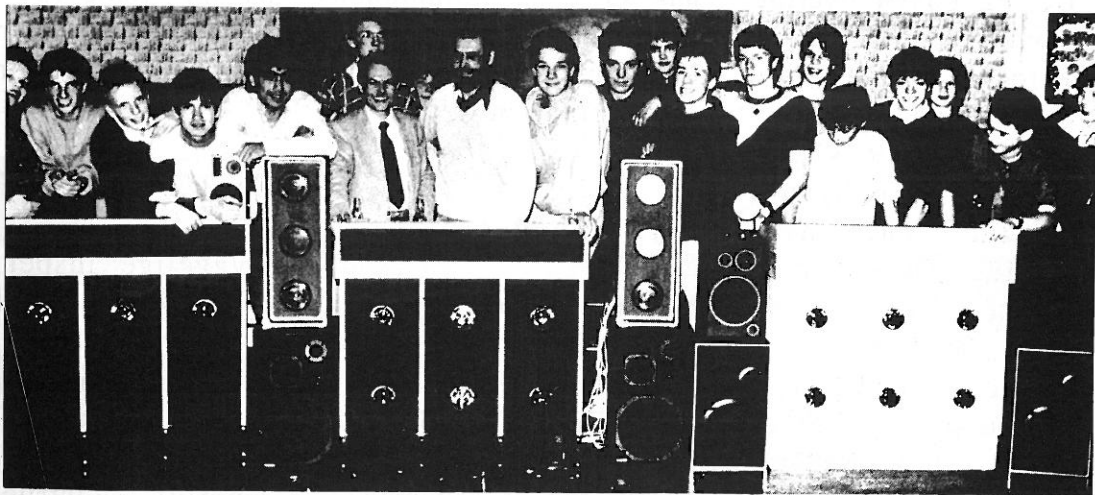
Et lysshow bliver til. Samarbejde træsløjd/elektronik.