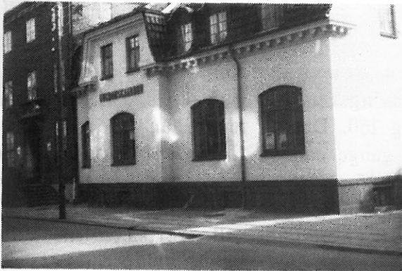
Ungdomsgården, Dalgasgade 11