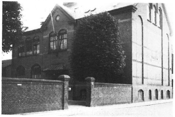
Skolen i Bethaniagade