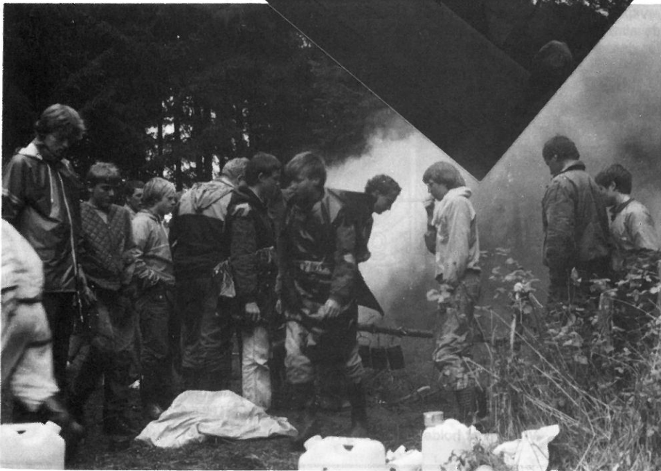
VILDMARKSTUR MED UNGDOMSSKOLEN